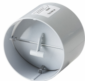
Kallrasspjäll Calima Art. Nr 8127-1